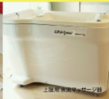
上級用 水筒マッサージ器