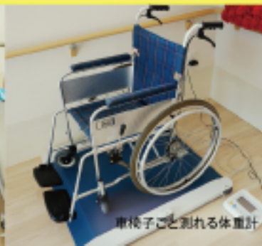
車椅子ごと測れる体重計