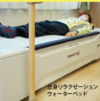
全身リラクゼーション ウォーターベッド