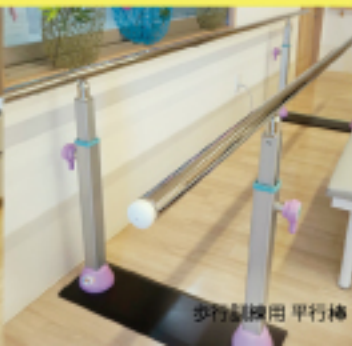
歩行訓練用 平行棒